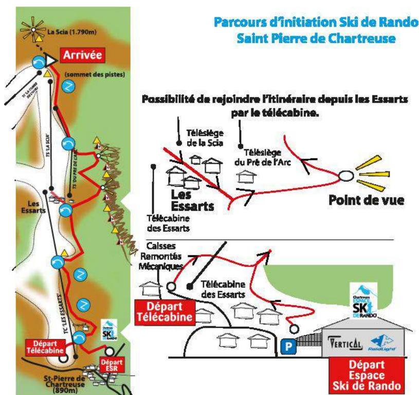
Figure 3 : Itinéraire du parcours d'initiation de ski de randonnée

ski de randonnée, puisque de nombreux trailers font du ski de randonnée l'hiver. Cependant, l'objectif et la cible visée sont beaucoup plus larges ; en effet, "le but est d'initier les gens pour qu'ils puissent ensuite pratiquer en montagne", "beaucoup de gens veulent se mettre au ski de rando ; ils aimeraient s'y mettre mais ils ne savent pas comment faire, parce que c'est compliqué". L'objectif est aussi commercial, car la société Raidlight, spécialisée dans la fabrication de vêtements et de chaussures pour le trail, a racheté, en 2010, la société Vertical, elle-même spécialisée dans la fabrication de vêtements de montagne. Ce projet a rapidement reçu l'adhésion du PNR de Chartreuse et de la communauté de communes puisque, en répondant "au souhait de la clientèle touristique demandeuse de séjours multi-activités", il faisait écho à leur objectif de diversification touristique. Pour mener à bien ce projet, Raidlight a sollicité l'accord de l'ONF pour l'usage des chemins forestiers menant au sommet de la station et en faire ainsi des itinéraires de montée qui n'empiètent pas sur le domaine skiable.