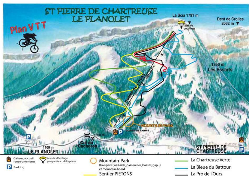
Figure 1 : Plan des pistes de VTT de descente

les aménagements réalisés ont permis l'investissement du site par une nouvelle activité avec l'arrivée de pratiquants autonomes. Le site de pratique est devenu par la suite un spot reconnu car "le spot est autant fait par les pratiquants que par les propriétés physiques qui font le spot" (Rech, Briot et Mounet, 2009). Comme l'explique en effet un internaute : "Le nombre de pistes est assez limité (une piste de chaque couleur avec quelques variantes possibles), mais la difficulté est bien dosée. De la noire très technique à la verte qui serpente en sous-bois, tout le monde y trouve son compte : confirmés, débutants, etc."