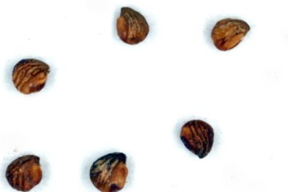
Figure 2.— Akènes de Potentilla supina subsp. tunetica (récolte du 28 mai 2007 à Draâ Boultif).

Dans ses travaux, Soják (1993, 2005) indique que dans l'aire englobant le sud de l'Europe, l'Afrique et l'Asie centrale, n'apparaît pas qu'une seule sous-espèce particulièrement pubescente avec des akènes ayant une protubérance conique, mais plutôt trois sous-espèces de base et quatre sous-espèces de transition (probablement d'origine hybride) ayant toutes la même pubescence et protubérance conique. Parmi ces caractères, la densité de la pubescence serait sous le contrôle du milieu, et seule l'ornementation de l'akène constituerait un critère taxinomique distinctif.