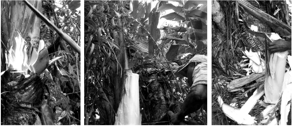
Figure 2. — Prélèvement du cœur de Ravenala (forme 'bemavo') après dégagement des bases des pétioles.