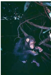
Photo 5 : Les insectes, termites et fourmis (ici un nid de fourmis œcophylles, ouvert avant d'en consommer le couvain), participent à l'équilibre protéique du régime du chimpanzé. Ils constituent surtout une ressource en graisses particulièrement appréciée.

Photo 4 : Les feuillages des légumineuses, notamment ceux de Baphia leptobotrys , constituent une part importante des apports protéiques.