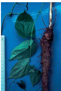
Photo 8 : Une des nombreuses espèces d'ignames des forêts denses africaines, Dioscorea praehensilis , dont les tubercules, peuvent apporter, surtout après cuisson, l'important apport calorique qui fut nécessaire au métabolisme de l'encéphale du genre Homo .

Photo 7 : Les chenilles constituent encore, pour les populations forestières, un aliment abondant et riche en graisses. Cuites avec des feuilles de Gnetum , elles constituent un plat délicieux.