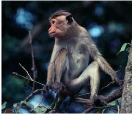
Photo 2 : Le macaque ( Macaca sinica ) qui, au Sri Lanka, cohabite avec les semnopithèques, est beaucoup plus sélectif dans ses choix d'une très grande diversité de végétaux dont il sélectionne quelques éléments. Il peut consommer les pétioles des feuilles de ce Strychnos potatorum .

Photo 1 : Au lever du jour, dans une forêt du Sri Lanka, les groupes de semnopithèques ( Semnopithecus entellus ) commencent la quête d'une grande diversité de fruits et de feuillages.