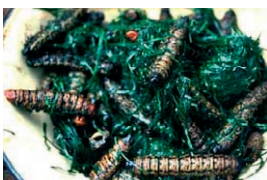
Photo 7 : Les chenilles constituent encore, pour les populations forestières, un aliment abondant et riche en graisses. Cuites avec des feuilles de Gnetum , elles constituent un plat délicieux.

Photo 6 : Les termites sont collectés, au moment de l'essaimage, par les populations forestières d'Afrique centrale et leur goût de noisette, relevé d'un peu de piment en fait un mets fort apprécié.