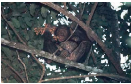
Photo 3 : Des fruits très variés, ici ceux du Calamus deeratus de la forêt du Gabon, apportent l'essentiel des apports caloriques à un chimpanzé.

Photo 2 : Le macaque ( Macaca sinica ) qui, au Sri Lanka, cohabite avec les semnopithèques, est beaucoup plus sélectif dans ses choix d'une très grande diversité de végétaux dont il sélectionne quelques éléments. Il peut consommer les pétioles des feuilles de ce Strychnos potatorum .