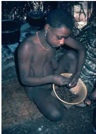
Photo 6 : Les termites sont collectés, au moment de l'essaimage, par les populations forestières d'Afrique centrale et leur goût de noisette, relevé d'un peu de piment en fait un mets fort apprécié.

Photo 5 : Les insectes, termites et fourmis (ici un nid de fourmis œcophylles, ouvert avant d'en consommer le couvain), participent à l'équilibre protéique du régime du chimpanzé. Ils constituent surtout une ressource en graisses particulièrement appréciée.