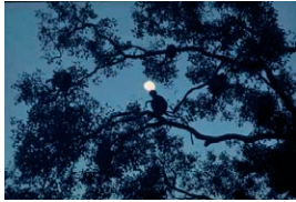
Photo 1 : Au lever du jour, dans une forêt du Sri Lanka, les groupes de semnopithèques ( Semnopithecus entellus ) commencent la quête d'une grande diversité de fruits et de feuillages.